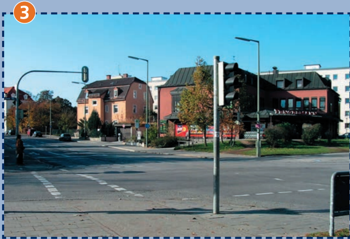
Kreuzung Weinbergerstraße/Planegger Straße