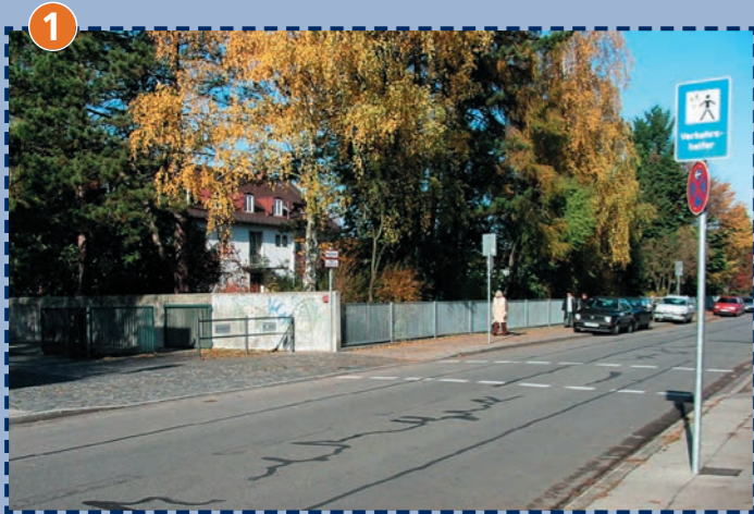
Übergang Bäckerstraße 58